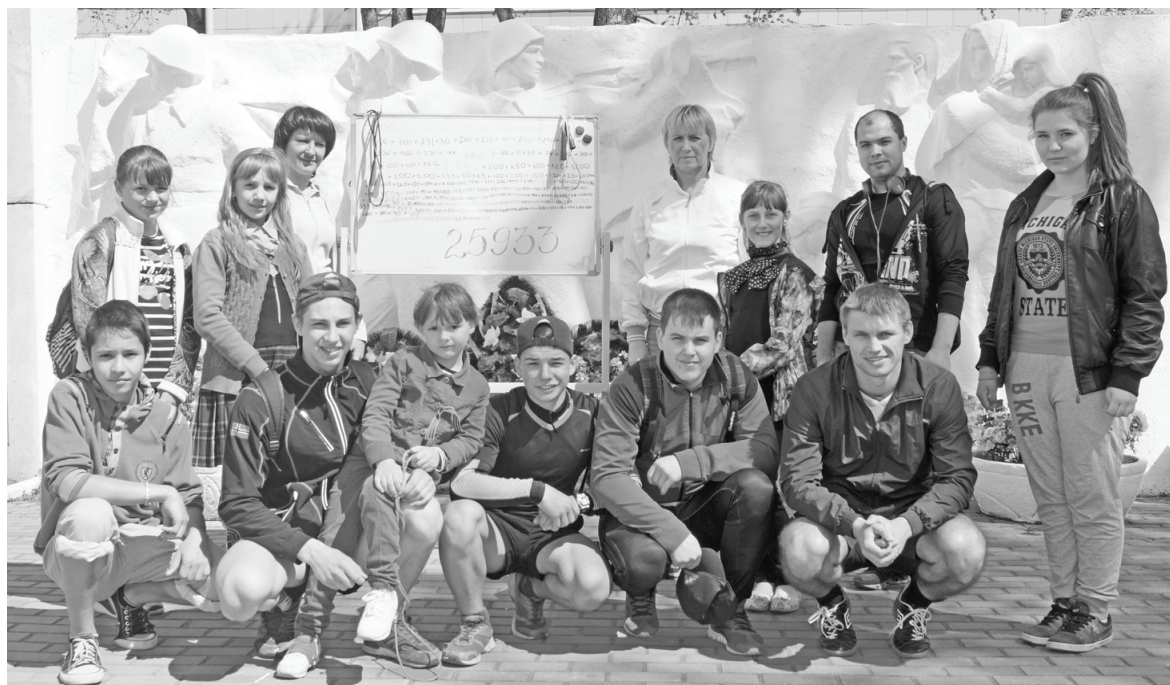
Инициаторы и участники акции «Рекорд Победы 25933».

Поскольку участников было много - 12 сборных, то нужно отметить хорошее выступление еще