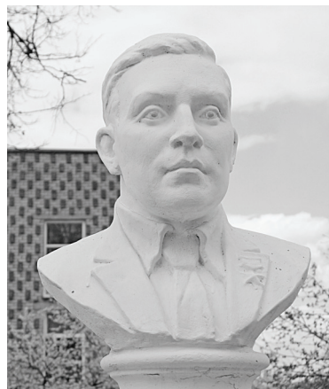
Бюст Героя в п.Думиничи.